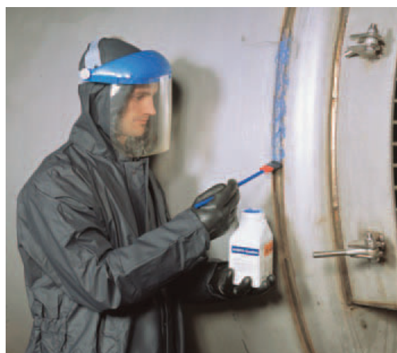
Нанесение пасты Avesta BlueOne™ 130 – с помощью кисти- Самая Безопасная Технология