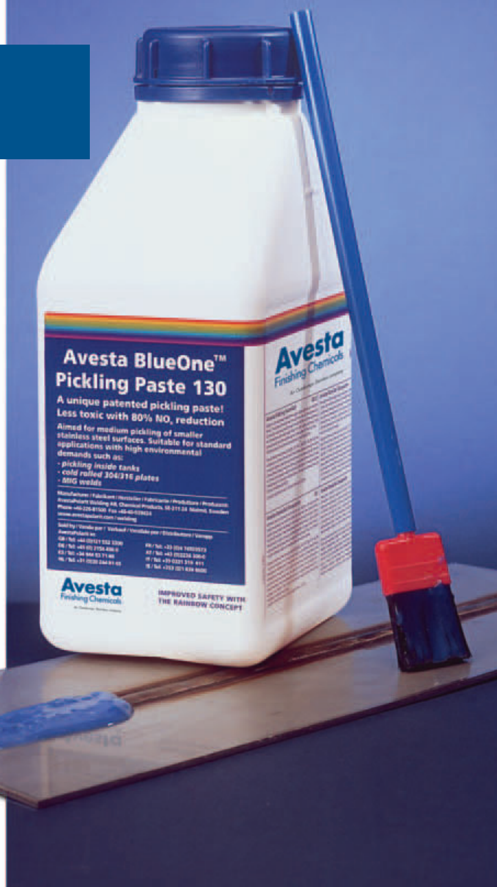
Avesta BlueOne™ Pickling Paste 130 – Не имеющая аналогов запатентованная травильная паста.

уменьшение выделения паров на 70% по сравнению со стандартной пастой